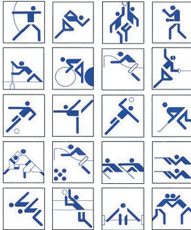
Munich, 1972 Otl Aicher